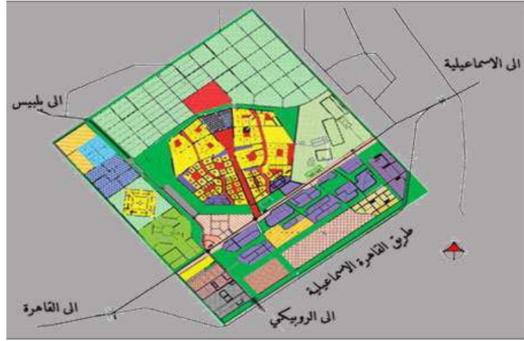
شكل رقم (٢) تقسيم العاشر من رمضان