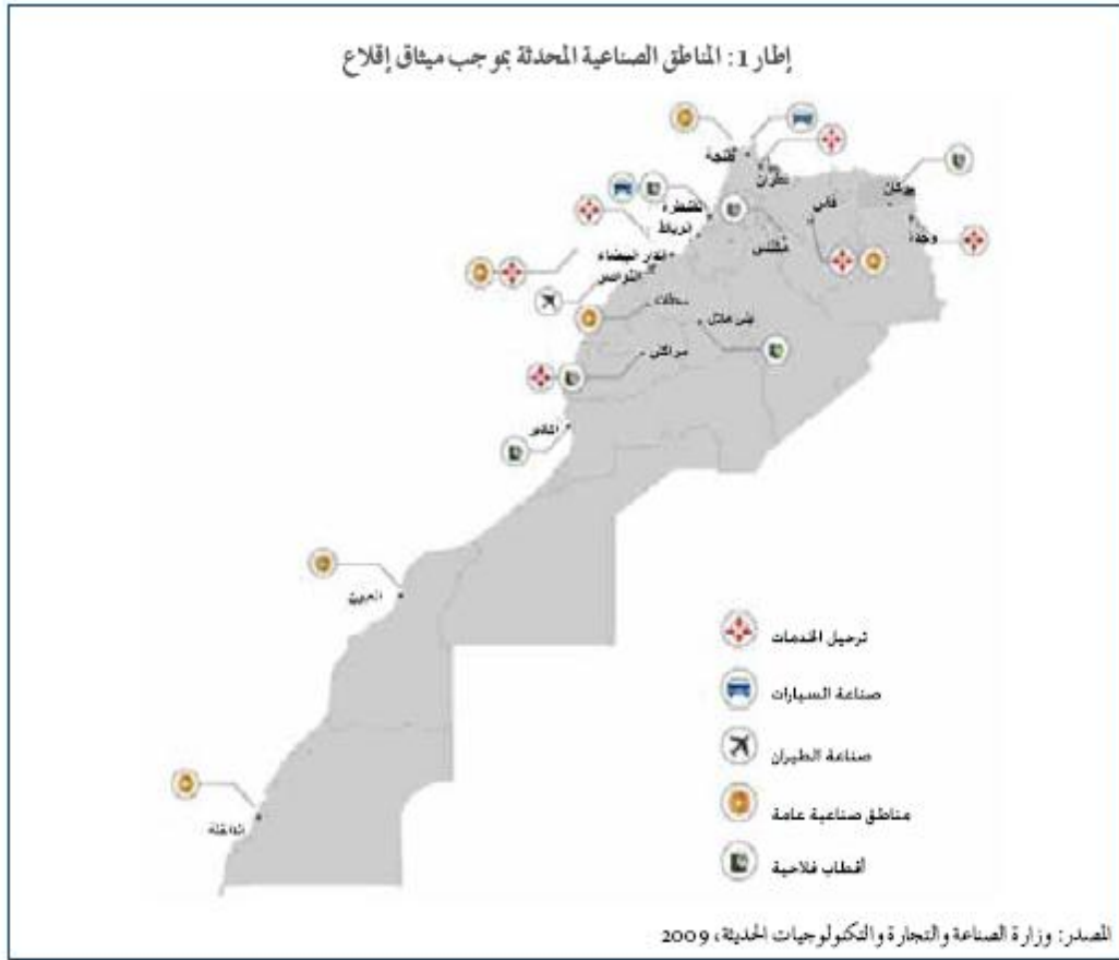
شكل رقم (٢) المناطق الصناعية المحدثة بالجهات المغربية

وقد ساهم برنامج الإقلاع الصناعي الجديدة للمغرب، في إعطاء الانطلاقة لستة قطاعات واعدة يُتوقع أن تلعب دور القاطرات الاقتصادية للمغرب، ويتعلق الأمر بالقطاعات التالية: