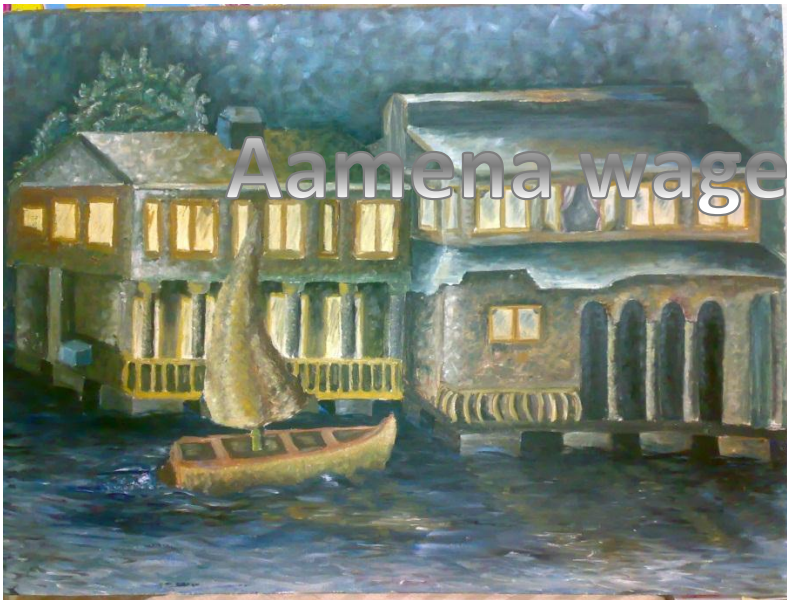
Aamena wageeh kamal