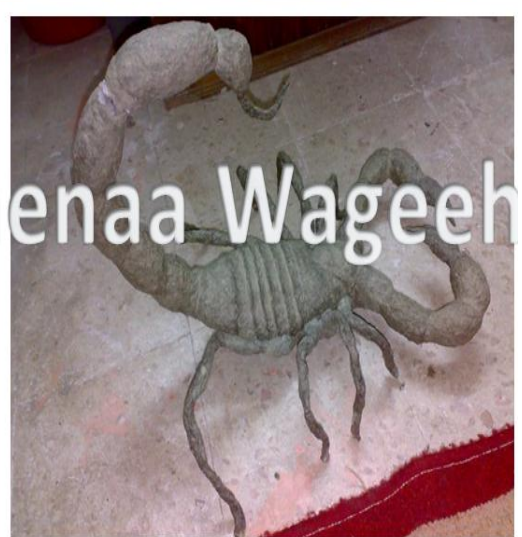
Aamena Wageeh Amena Wageeh